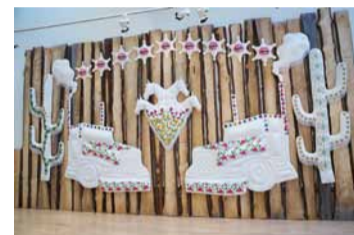
Estetiken kring den ensamma cowboyn, rodeo och country-musiken är central i utställningen "Supernova".