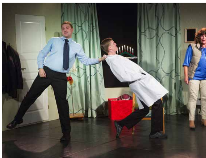
En ensemblen med imponerande energi och tajming.