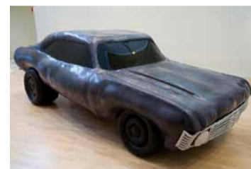
En härlig men lite elak Chevrolet som för tankarna till en skimrande oljefläck.