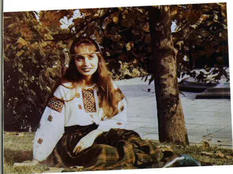
TRADITIONELLT. Konstnären på Jalta i ukrainsk folkdräkt, 20 år gammal. Året är 1990. "Jag hade inga andra kläder och det fanns inget att köpa. Det var mina paradkläder", säger hon.

► egna historia är full av dramatik. Konstnären växte upp i Sovjetunionen och mer exakt på Jalta på Krimhalvön. Hennes far var ryss och hennes mor var ukrainsk judinna. Det judiska arvet är inget hon själv brukar prata om.