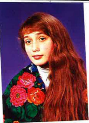
UNGDOM. Här är konstnären 14 år. Kort efteråt dog hennes mor och hon blev föräldralös.

»Då blev det lugn och ro och ingen mobbade mig. Då fick jag respekt. Man skämtade lite om vodka kanske.«