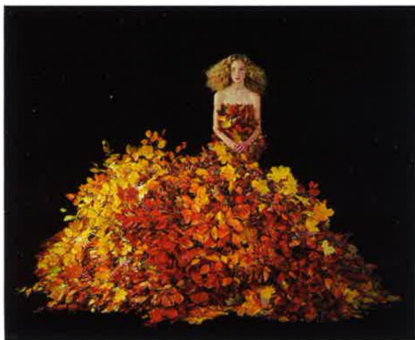
PREMIÄRVISNING. Oljemålningen över Kiev nedan är från 1985. Nathalia Edenmont gjorde den bara 14 år gammal efter att hon kommit in på en skola med konstnärlig inriktning i Kiev. "Jag minns att en lärare sprang till en annan och sa 'titta vilka färger'", säger hon. Ovan verket Essence .