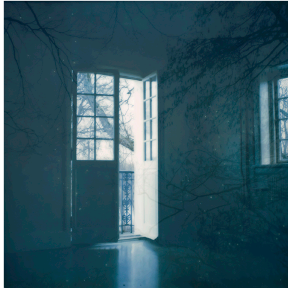
THE ROOM OF ETERNITY