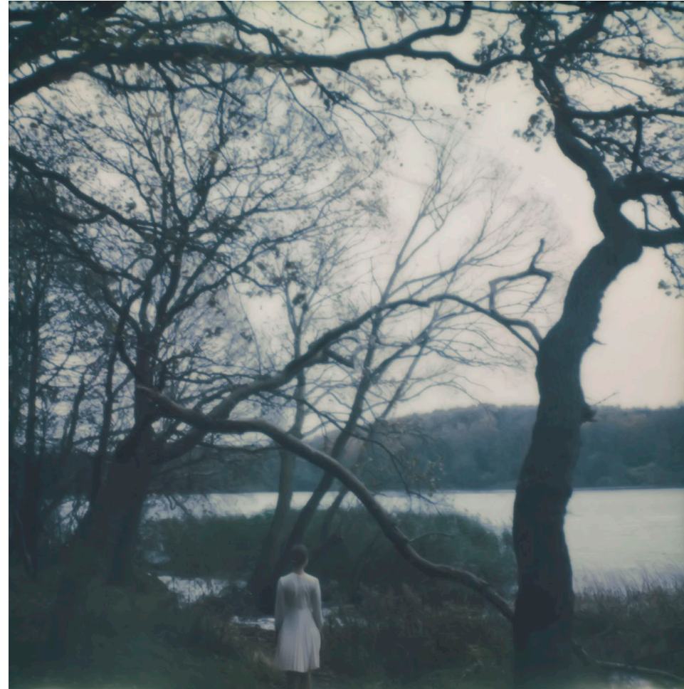
THE SHIFTING TREES