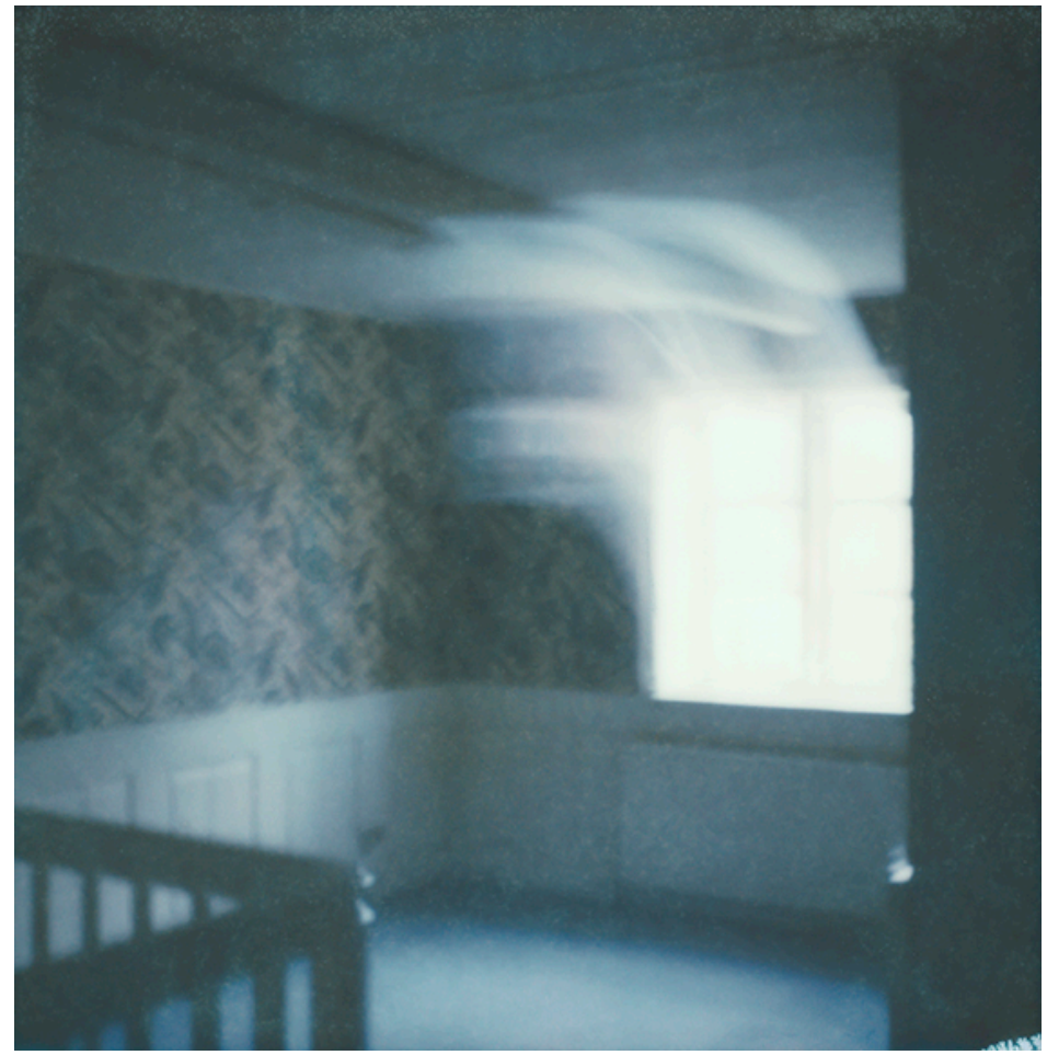
THE WINDOW TO THE UNKNOWN