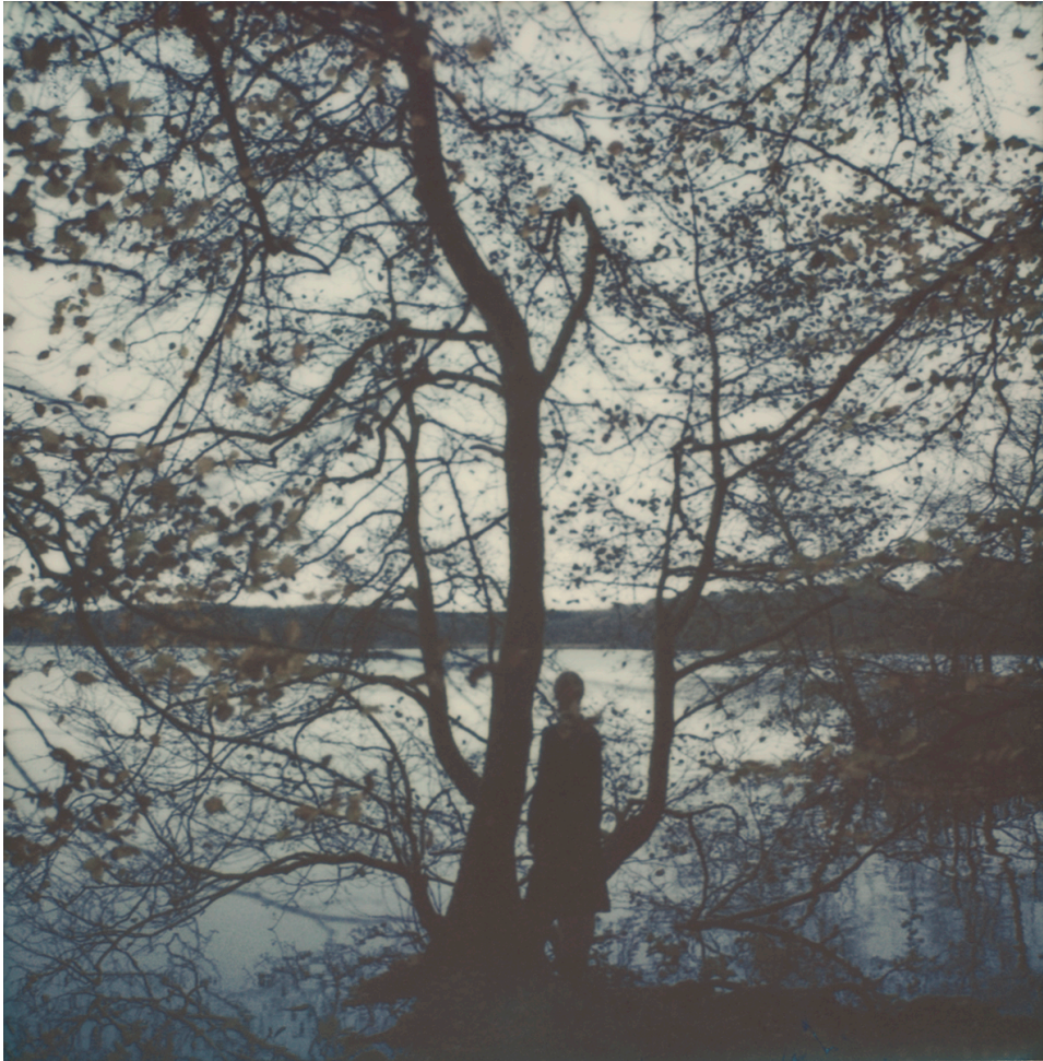
MERGING INTO THE LANDSCAPE