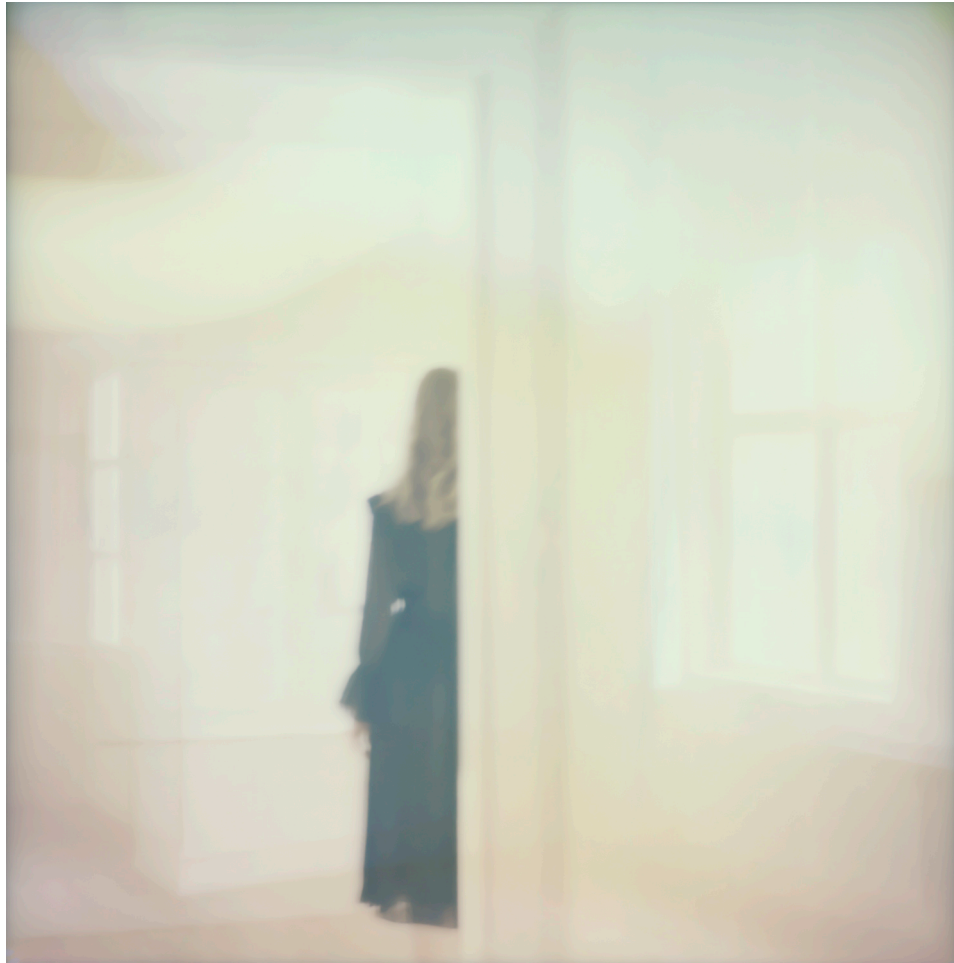
THE SHIFTING MEMORIES