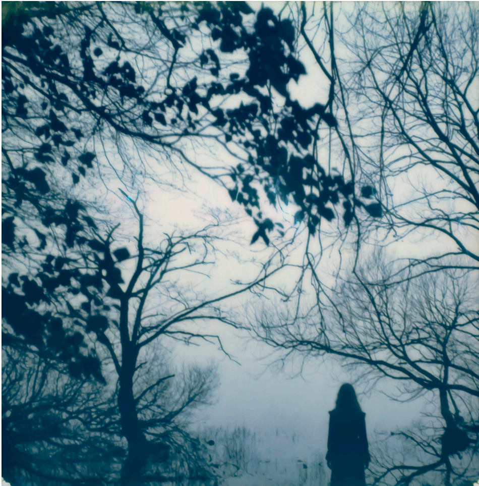
THE LANDSCAPE OF MEMORY