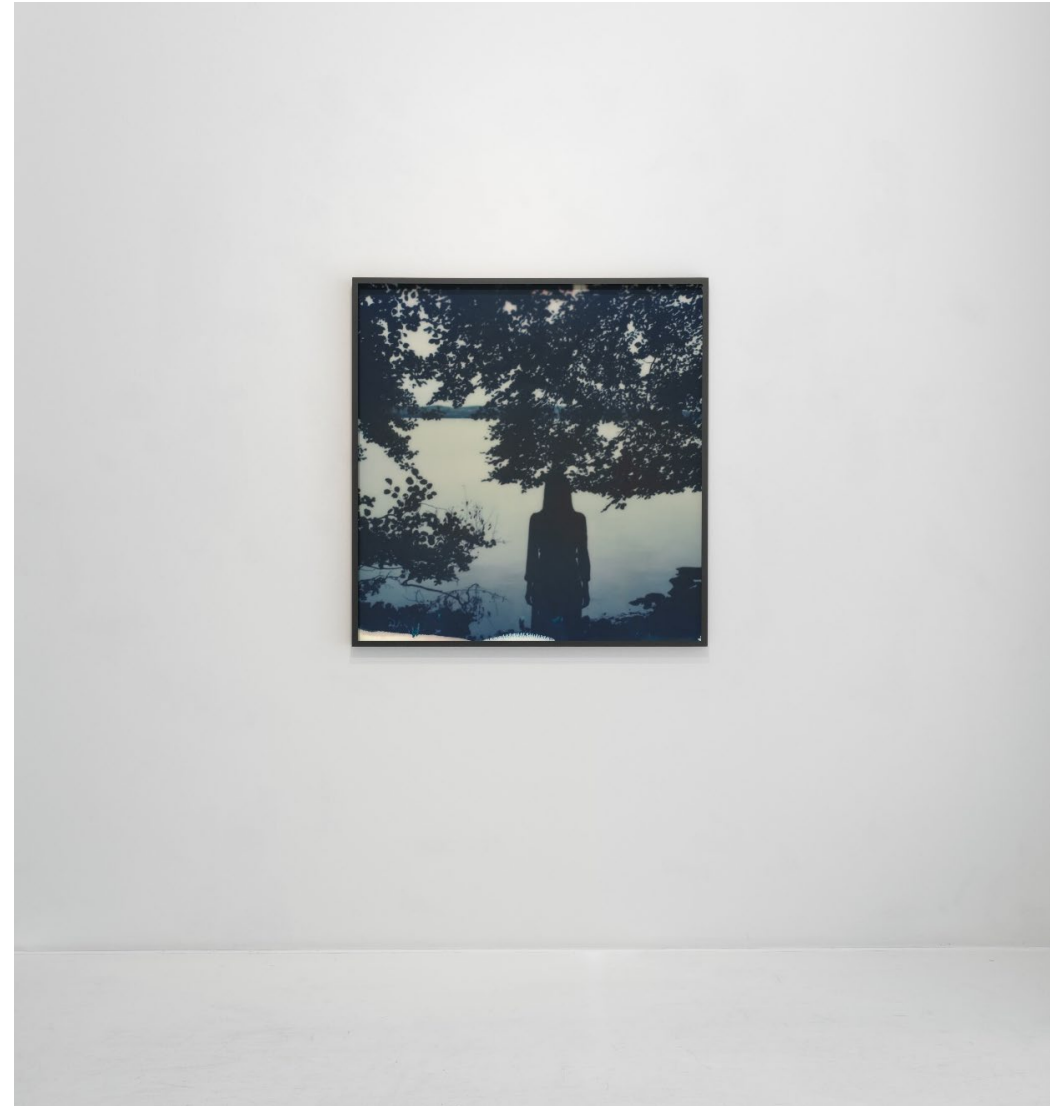
THE INFINITE LAKE

Mötet mellan ljus och mörker har länge präglat Astrid Kruse Jensens verk. I sina tidiga serier har hon arbetat tekniskt perfektionistisk och manipulativt använt avancerad ljussättning och mörkrets skuggor för att skapa kontrastrika och hyperrealistiska bilder. I "Floating" drar Kruse Jensen i stället nytta av de tekniska begränsningarna och det operfakta resultatet den enkla Polaroidkameran hon fotograferar med ger. Resultatet ger överexponeringar och oskarpa motiv som tillsammans med den distinkta färgskalan i cyan och gul ger verken en målerisk och poetisk framtoning.