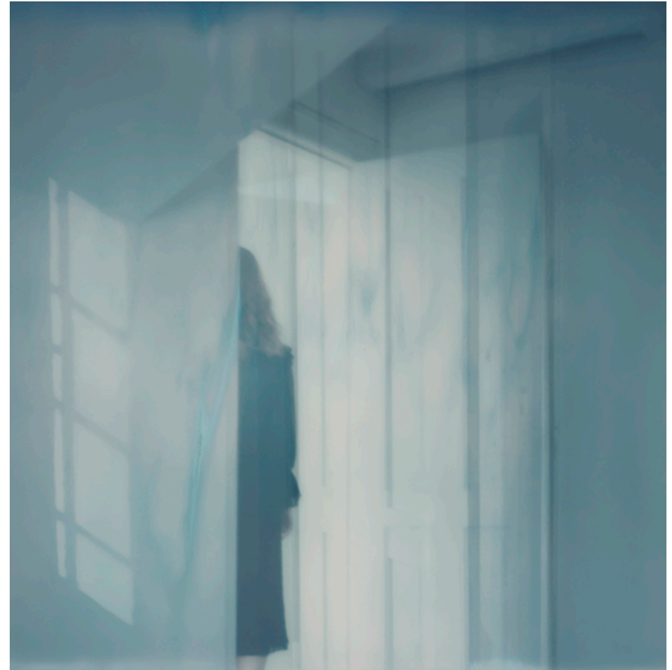
TOWARDS THE INSIDE