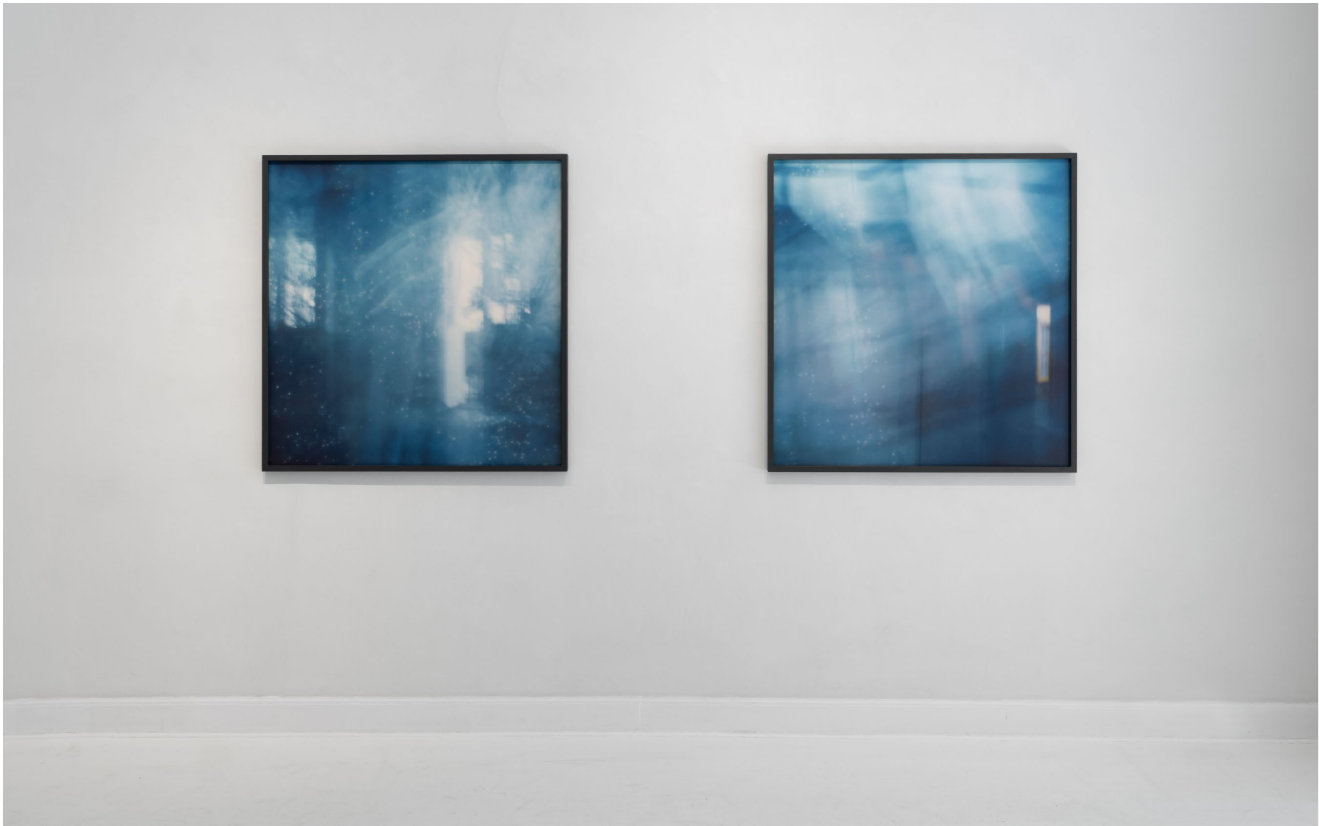
THE DRIFTING SPACE THE INFINITE SPACE