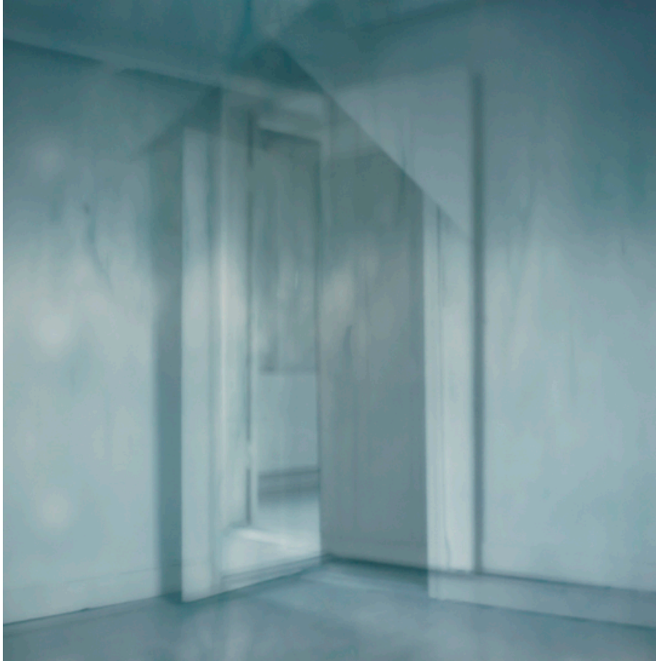
INTO THE UNKNOWN